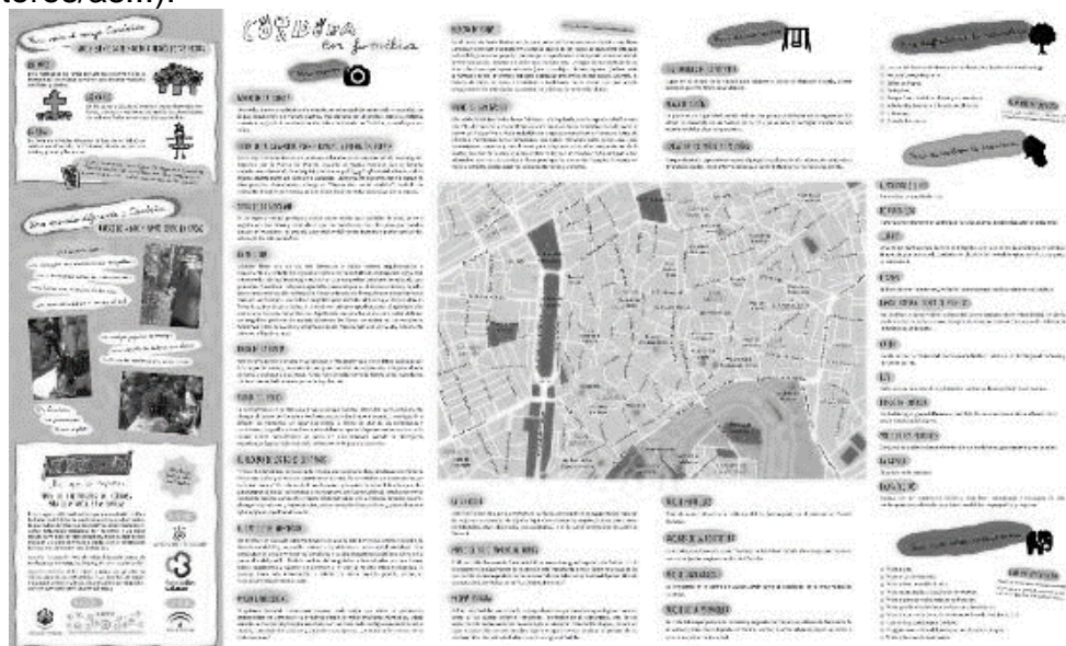
Figura 7. Anverso del Mapa MECOI-A