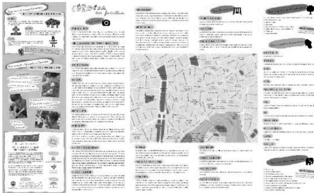
Figura 2. Anverso del Mapa Córdoba con Ojos de Infancia

Los excelentes resultados de estos proyectos (Autores, 2019; Autores, 2018) nos muestran, entre otras evidencias, que el diseño de propuestas educativas inclusivas, abiertas y plurales, en las que participe alumnado con distintas capacidades y talentos, facilita que la infancia pueda comprender las diferencias como una característica natural de los seres humanos de las que puede enriquecerse y aprender.