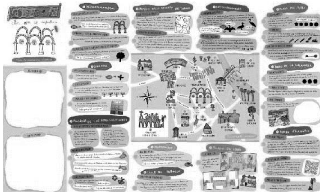
Figura 1. Reverso del Mapa Córdoba con Ojos de Infancia