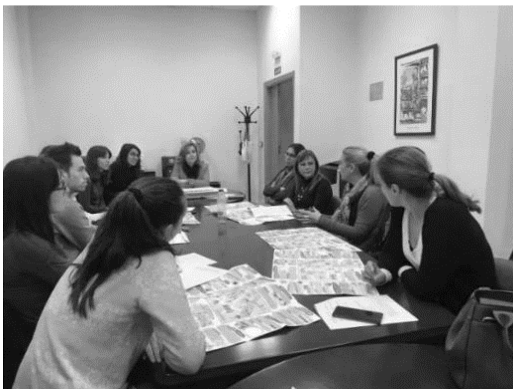
Figura 3. Equipo de trabajo MECOI-A