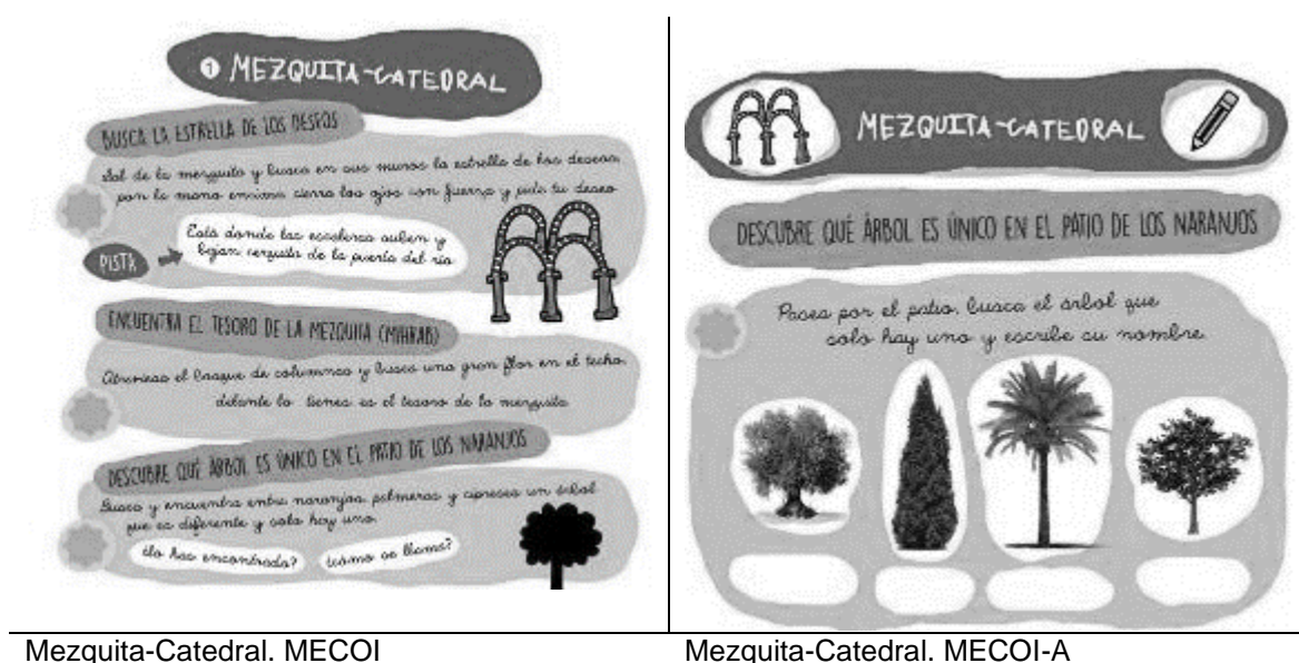
Figura 4. Adaptaciones del mapa MECOI-A para visitar la Mezquita-Catedral.

Por otro parte, en el lado izquierdo se incorpora un icono con la imagen representativa del lugar que se está visitando y en el lado derecho se incluye una imagen alusiva al material necesario para realizar las actividades. Por ejemplo, en el caso de la Mezquita Catedral, a la izquierda se sitúa una imagen simple con los arcos de la Mezquita y a la derecha una imagen con un lápiz que será el material básico necesario para realizar las actividades previstas en este enclave.