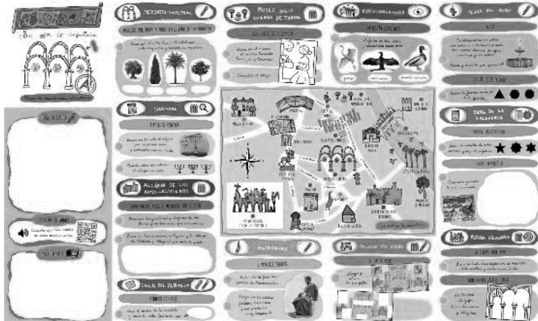
Figura 6. Reverso del Mapa MECOI-A