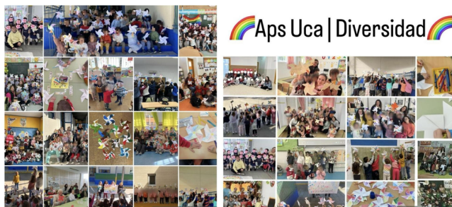
Figura 2. Transformación a molinillo en redes.

transformación, surge la idea de generar a partir de la esvástica de la pintada, un molinillo multicolor, que llegaría a convertirse en el logo del proyecto, estableciendo el acuerdo entre todos los equipos, de que los diferentes servicios deberán finalizar con una actividad de creación de molinillos coloridos que se fotografiarán (Ver figura 2), para realizar una campaña que visibilice al colectivo y la extensión del impacto en el entorno. Los distintos grupos se apropian de la necesidad que entienden y vivencian como injusta, naciendo el deseo de movilizarse para cambiarla.