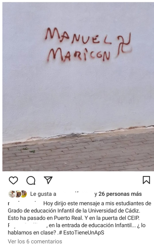
Figura 1. Mensaje desencadenante del proyecto.

en práctica durante todo el semestre. En este caso concreto que nos ocupa, el factor desencadenante fue una pintada (ver figura 1) realizada en un colegio de educación infantil hacia un profesor que trabajaba en el mismo.